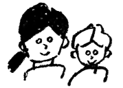
O.Sさま (お母さまとお子さま) Bコース

ものが多く散乱していたため使いにくかった子供部屋。収納スペースに合わせ、おさま自身で必要なものだけに見直した。ものの定位置を決めたことで片づけやすいスペースに変わり、お子様ご自身で片付けが出来るようになった。