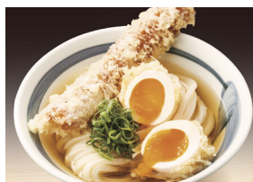
元祖セルフうどんの店 竹清