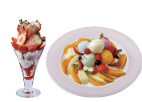
ホブソンス アイスクリームパラー