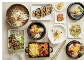
韓美膳(ハンビジェ)