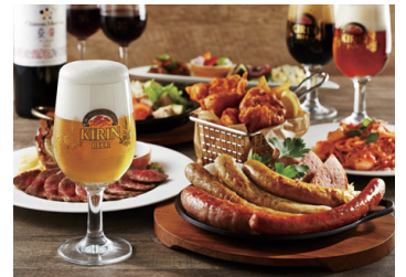
キリンシティプラス 2F