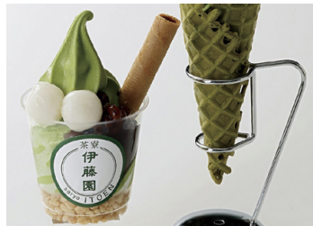
茶寮 伊藤園 2F