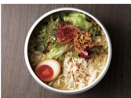
鶏白湯らーめん 自由が丘 蔭山