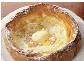
オリジナルパンケーキハウス