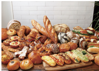
ベーカリーズ キッチン オハナ 1F