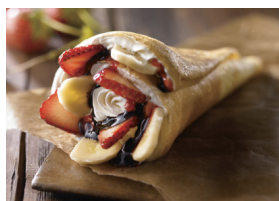
MOMI & TOY'S