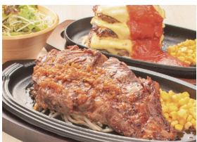
ステーキ&ハンバーグ デンバープレミアム