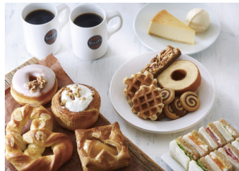
タリーズコーヒー 2F・4F