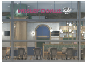
ミスタードーナツ カフェ 2F・4F