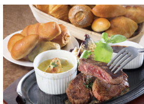
ベーカリーレストラン サンマルク