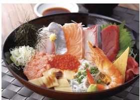
築地食堂源ちゃん