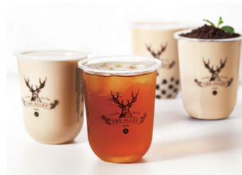
THE ALLEY 2F