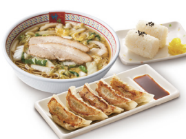
どうとんぼり神座