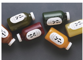
glow juice stand