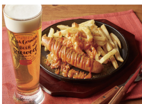
シュマッツ・ビア・ダイニング