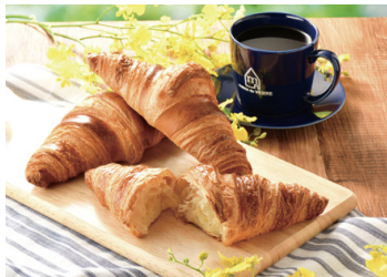
メゾン・ド・ヴェール 2F